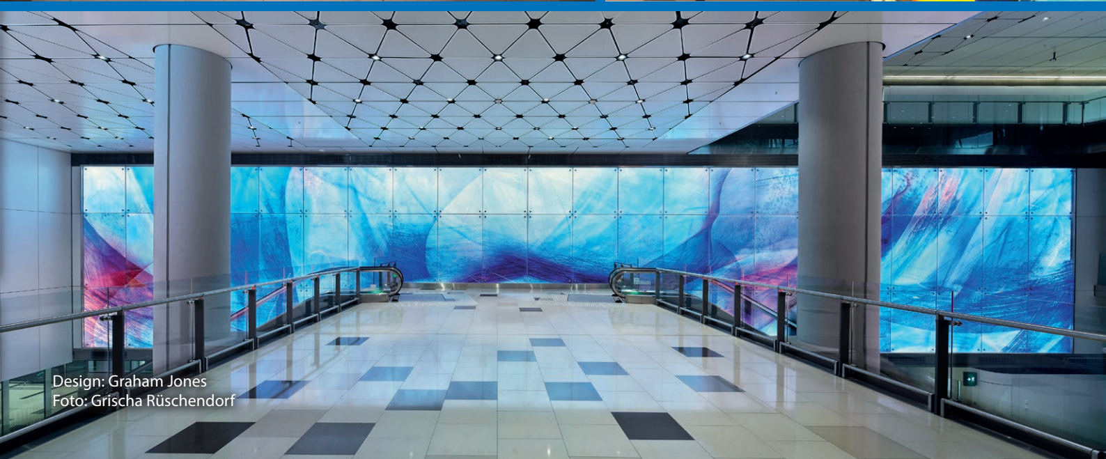
Design: Graham Jones