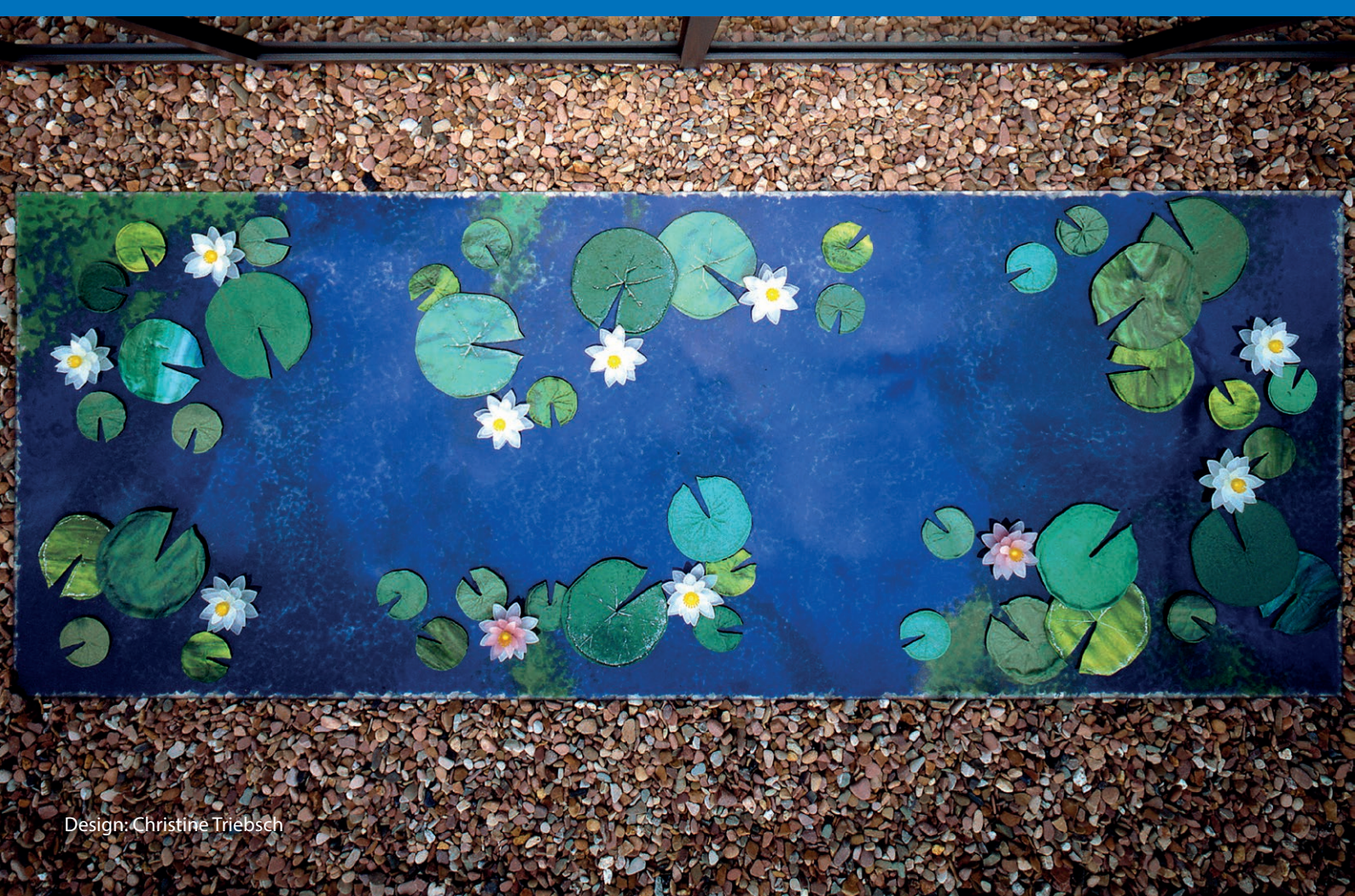
Design: Christine Triebisch