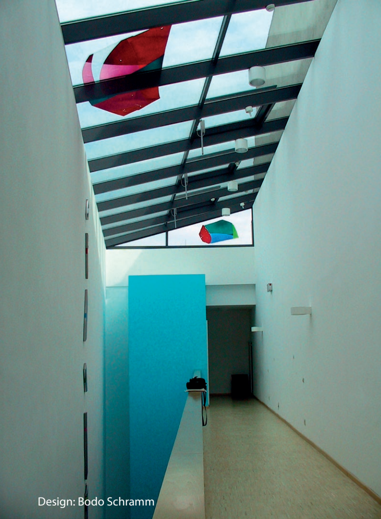
Design: Bodo Schramm