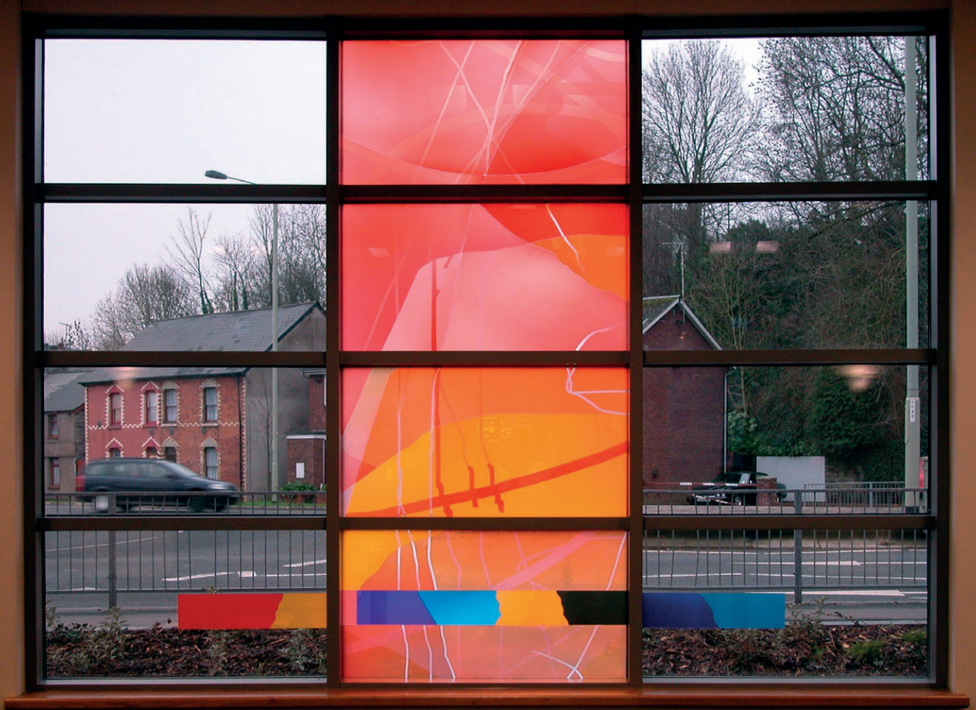
Design & Foto: Martin Donlin