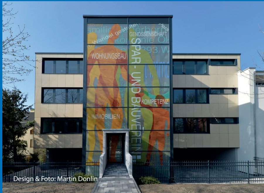
Design & Foto: Martin Donlin