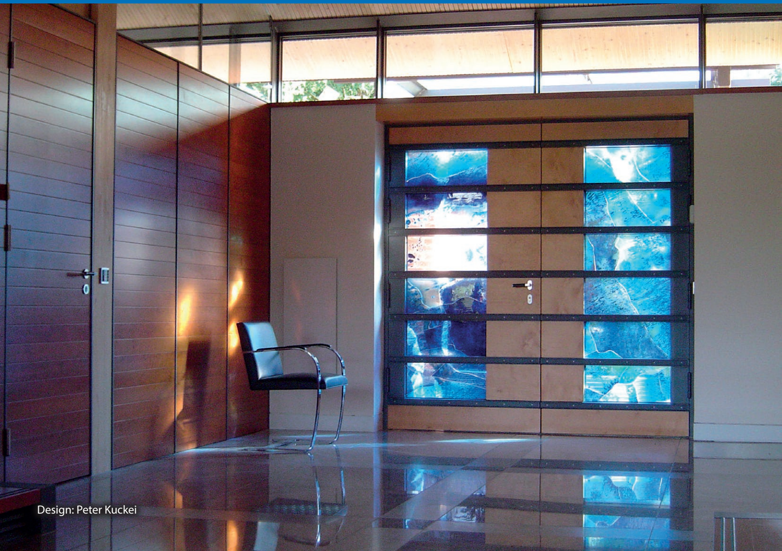
Design: Peter Kuckei