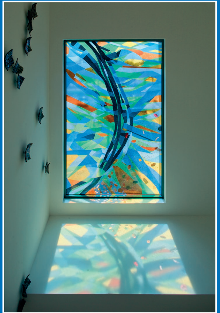
Mehrwert: KUNST schafft Atmosphäre