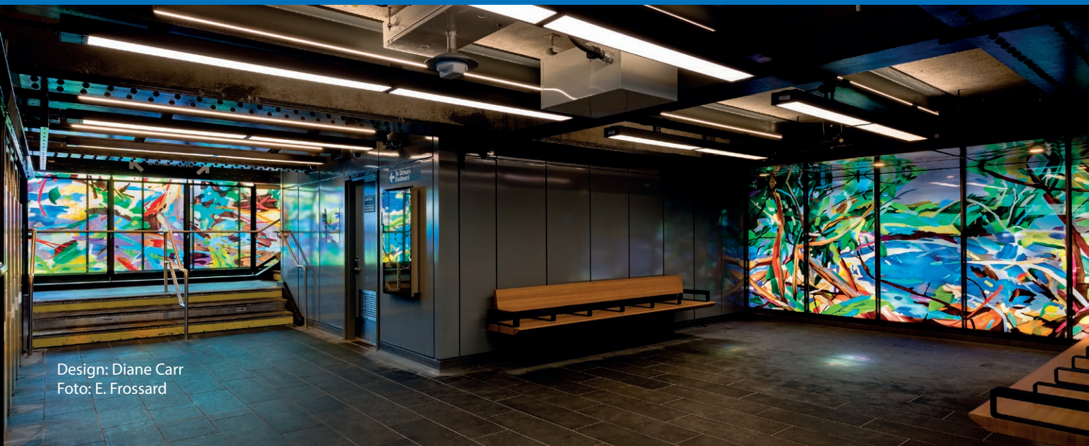
Design: Diane Carr

Unsere Projekte führen wir in enger Zusammenarbeit mit der Glasmalerei Peters aus, eine der renommiertesten Werkstätten für Glasgestaltung weltweit.