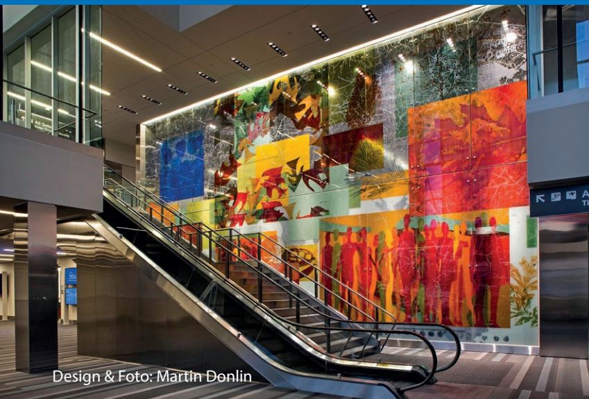
Design & Foto: Martin Donlin

Wir sind immer an Ihrer Seite als „Erfolgsgarant“ für Ihr Projekt.