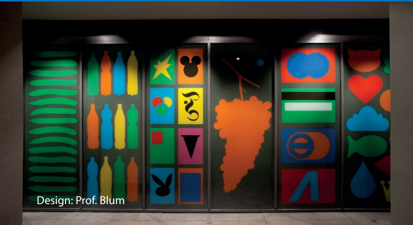
Design: Prof. Blum