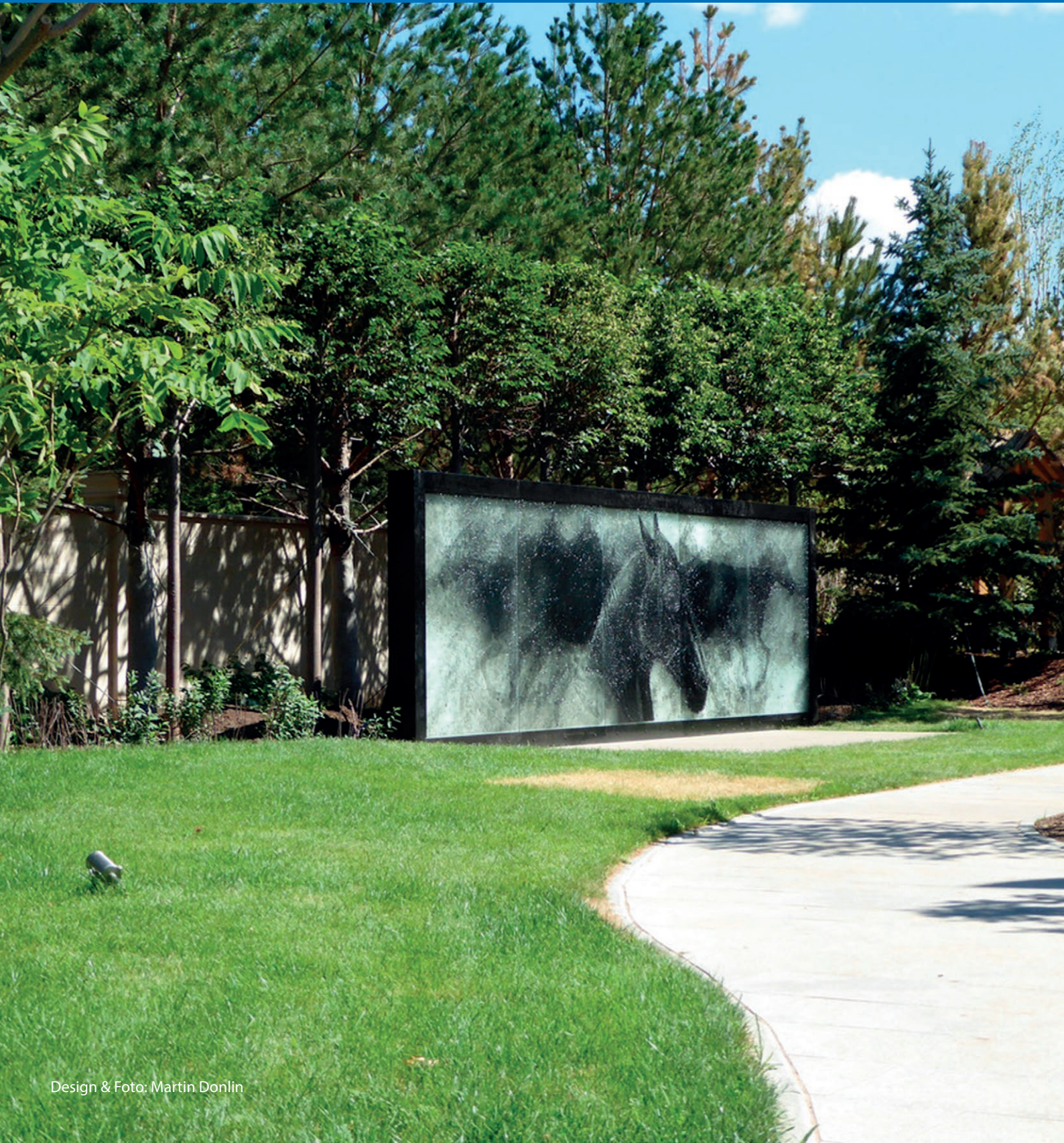
Design & Foto: Martin Donlin