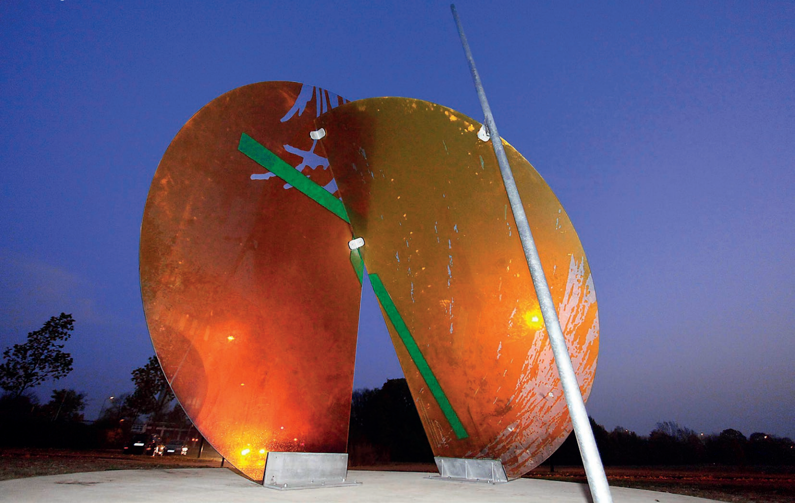
Design: Tobias Kammerer