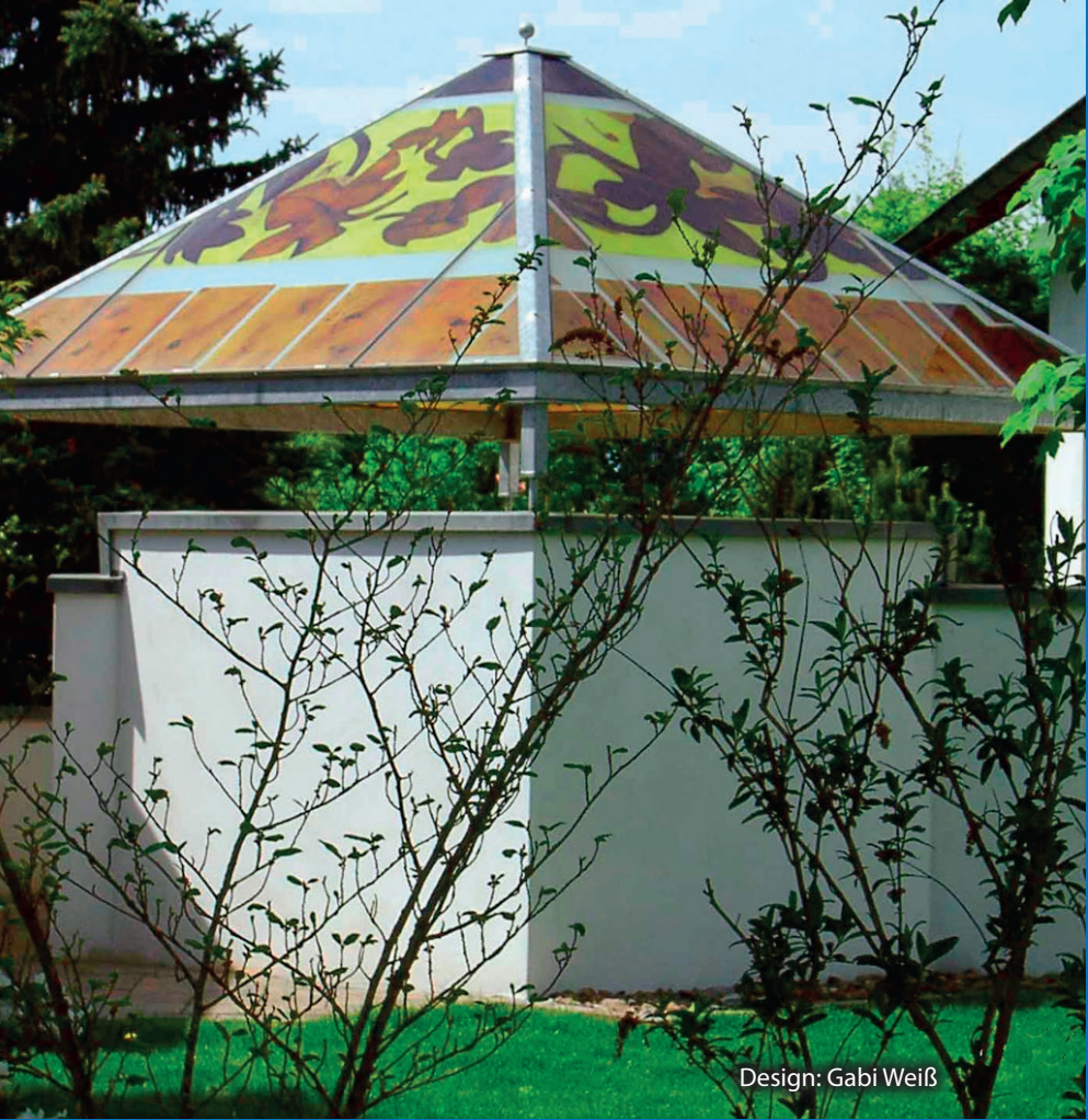
Design: Gabi Weiß