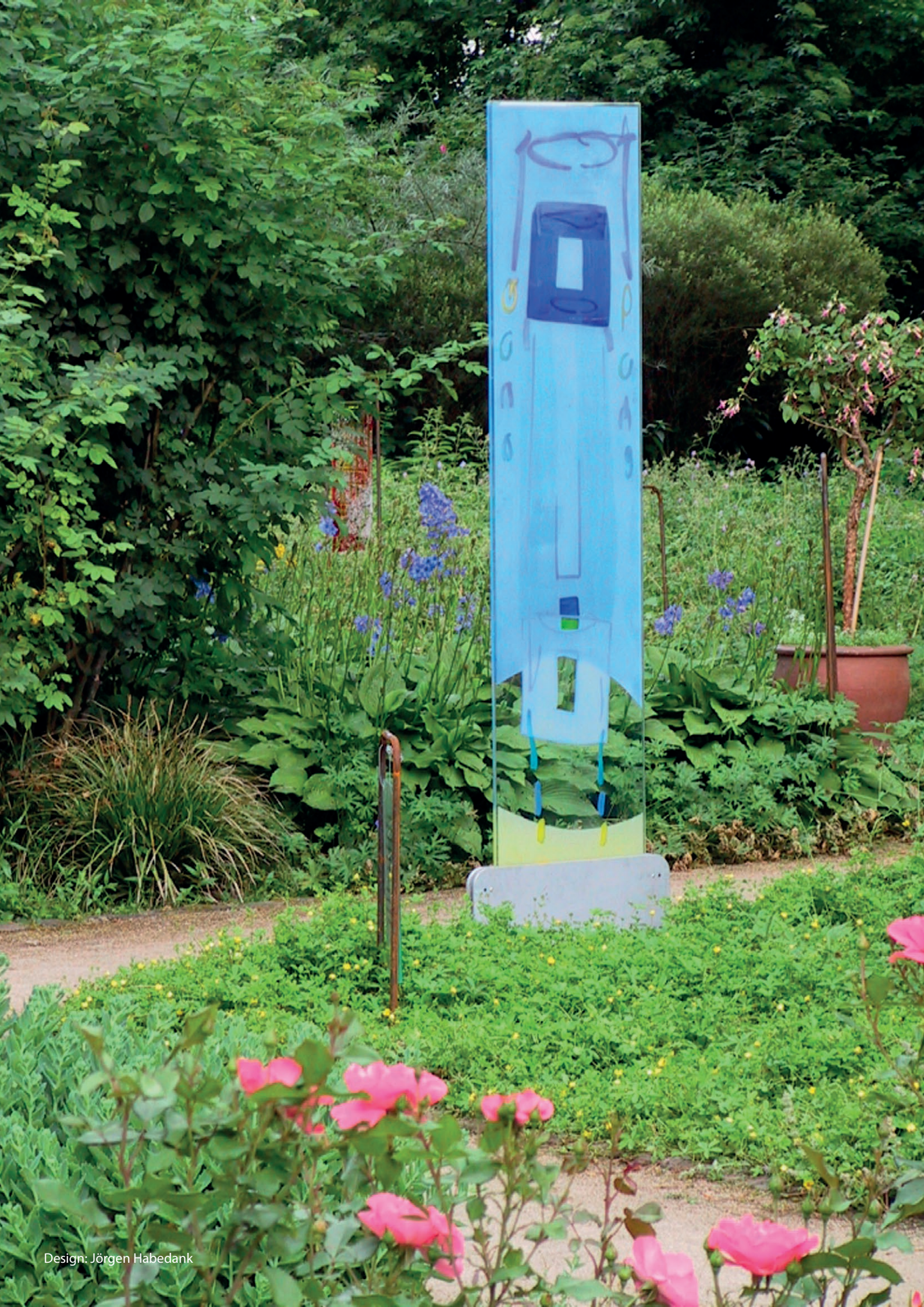
Design: Jörgen Habedank