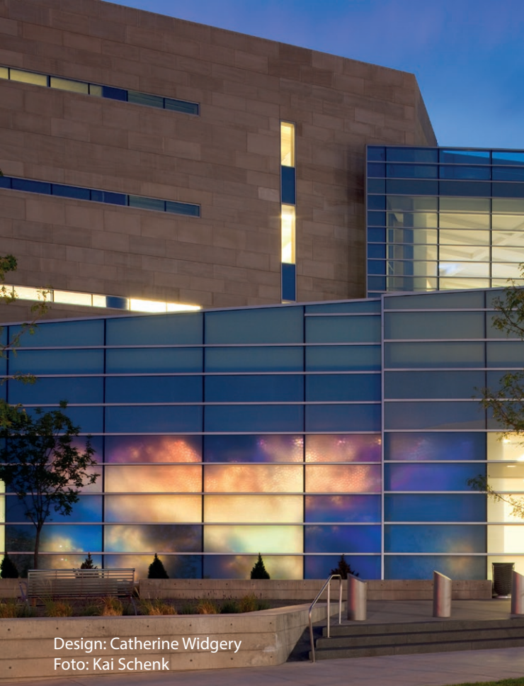
Design: Catherine Widgery