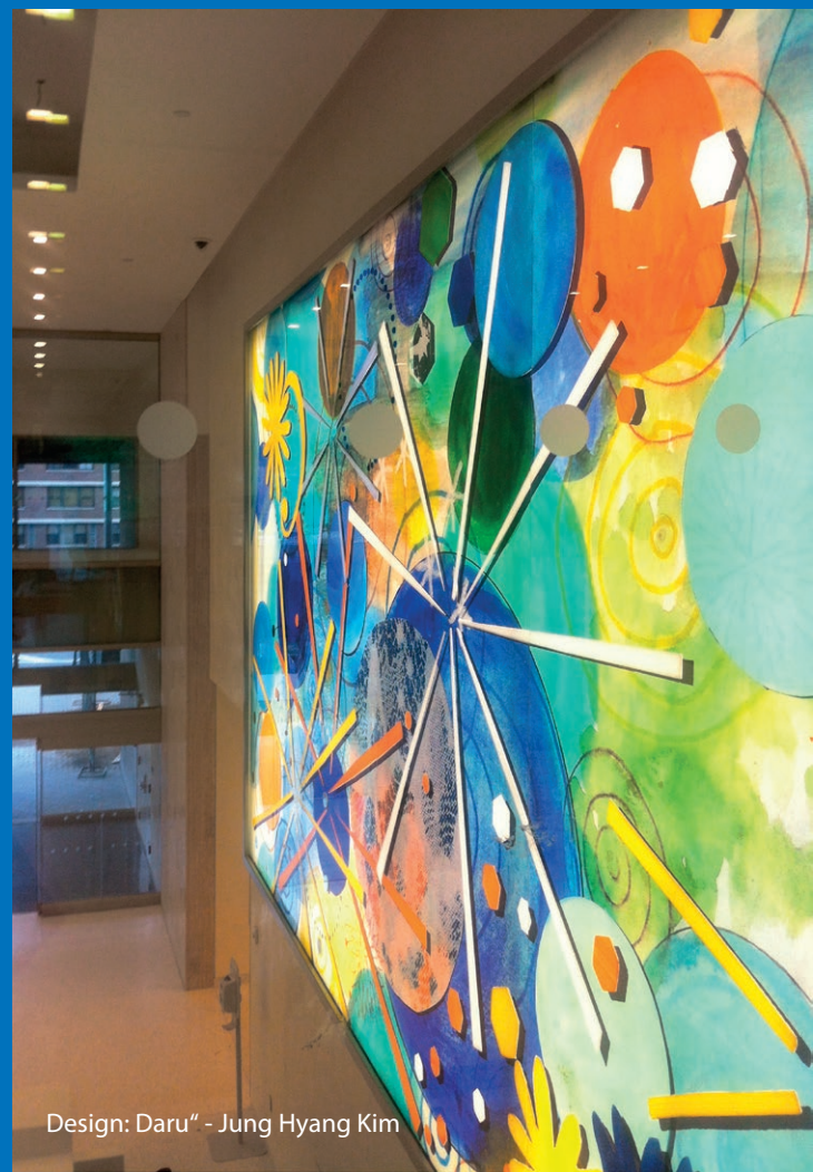
Design: Daru" - Jung Hyang Kim