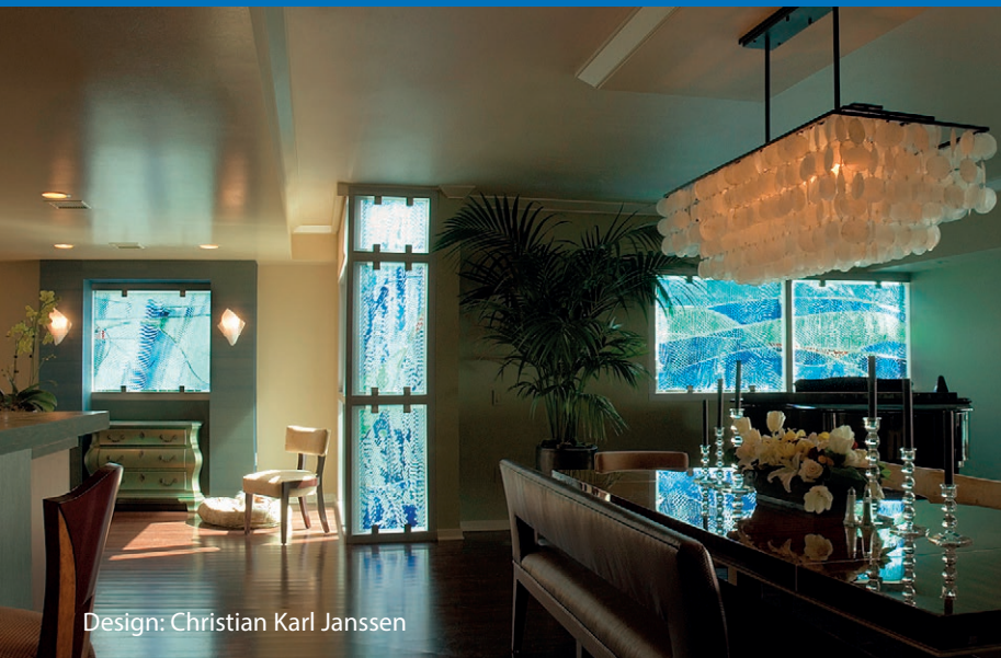
Design: Christian Karl Janssen

Bei unserer Zusammenarbeit mit über 300 nationalen und internationalen Künstlern finden wir auch für Sie die richtige Handschrift für Ihr Projekt.