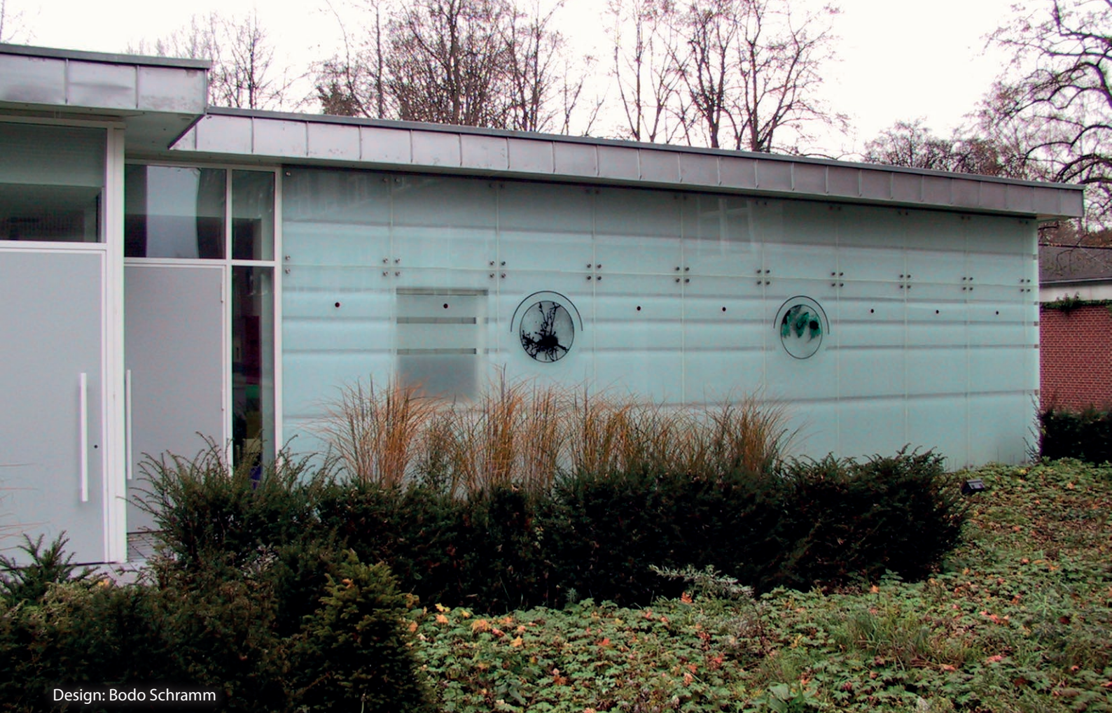
Design: Bodo Schramm