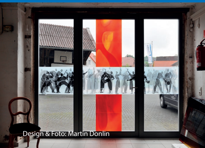
Design & Foto: Martin Donlin

Wir helfen Ihnen den richtigen Ort für Ihr Kunstwerk zu finden!