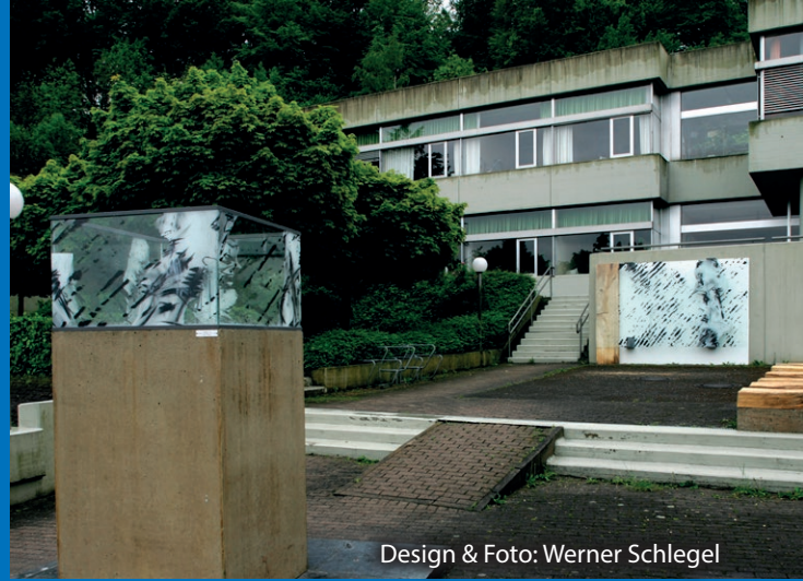
Design & Foto: Werner Schlegel

Auch im Außenbereich sind der Gestaltung keine Grenzen gesetzt. Hier gibt es Gartenobjekte wie Stelen oder Figuren, Zäune und Sichtschutz, Pavillons und Sonnendächer, Fassade, Balkonverkleidung, Türschilder und sogar gestaltete Glashäuser sind möglich.