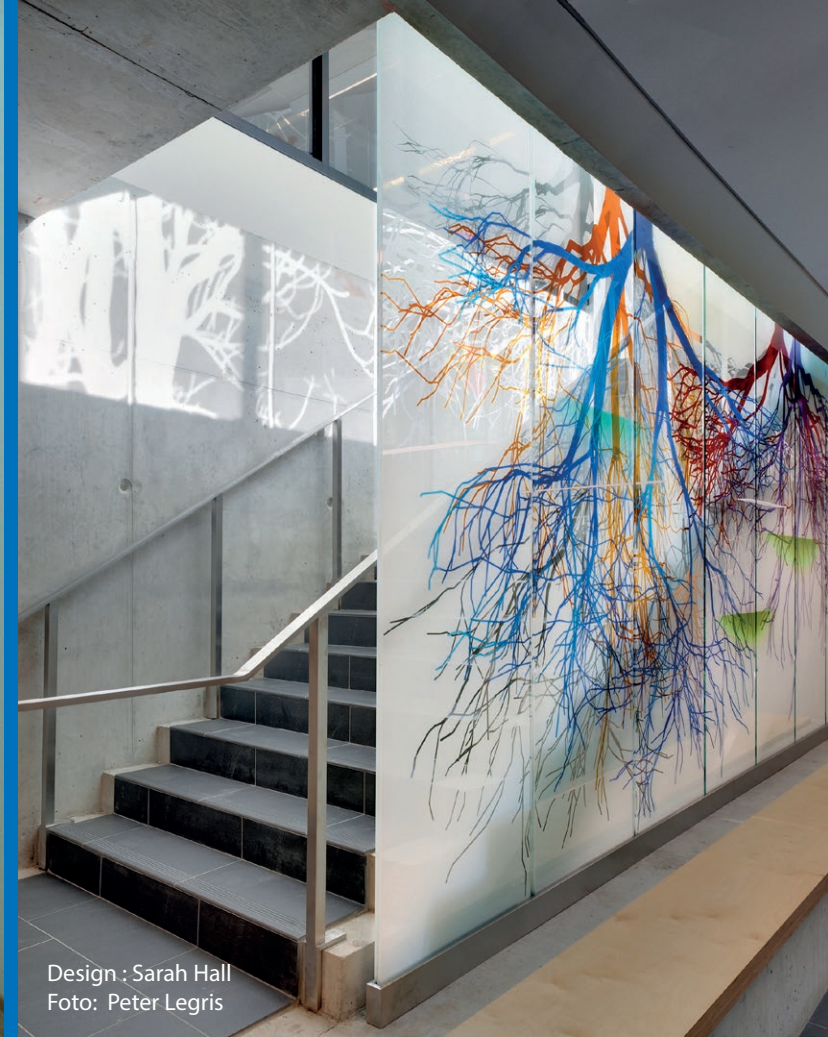
Design : Sarah Hall