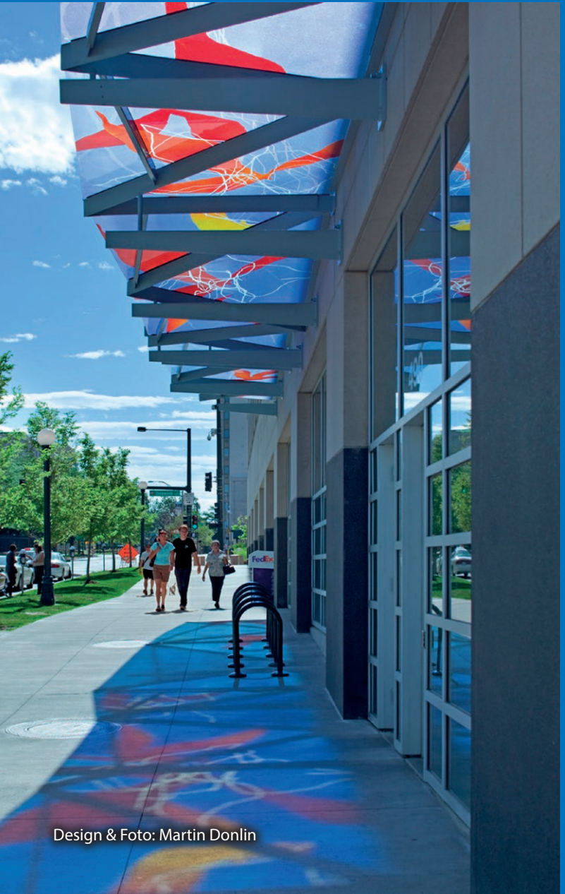
Design & Foto: Martin Donlin