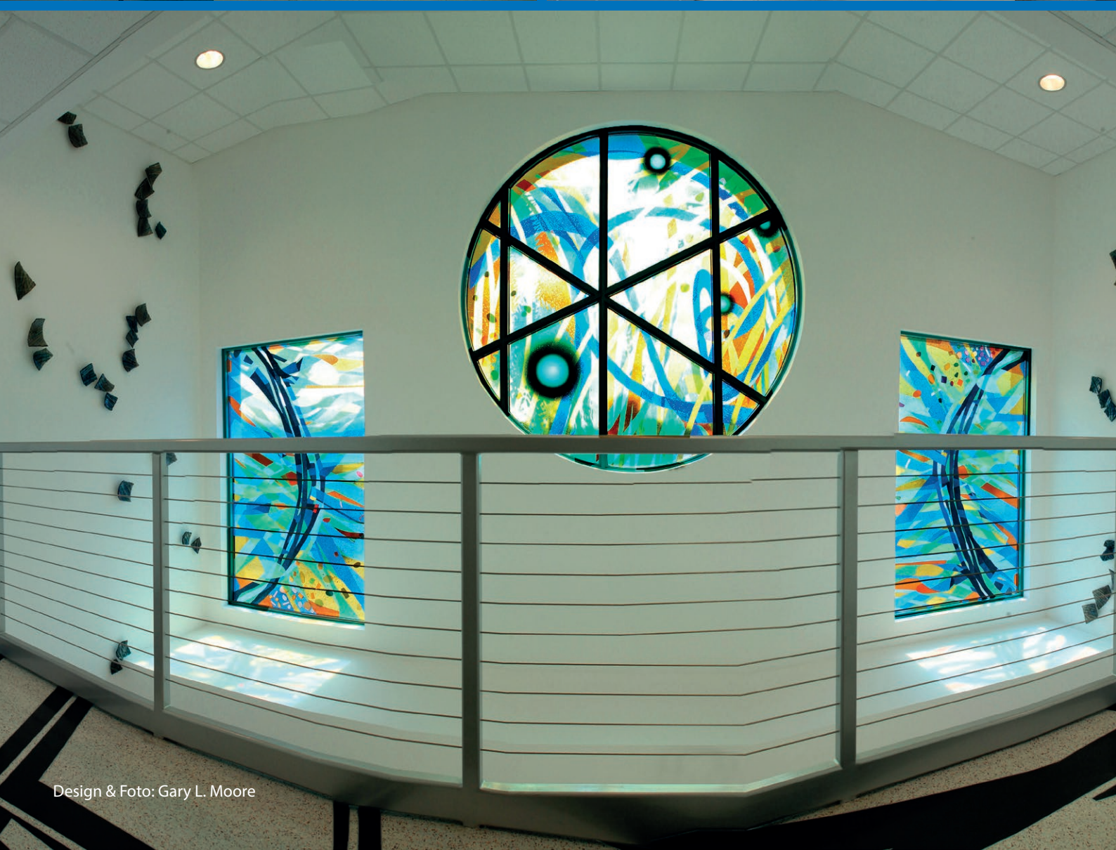
Design & Foto: Gary L. Moore