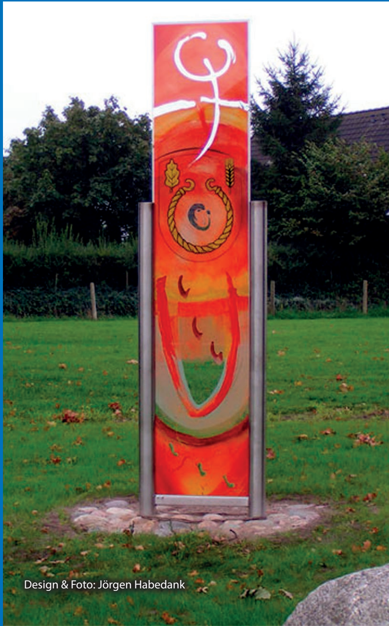
Design & Foto: Jörgen Habedank