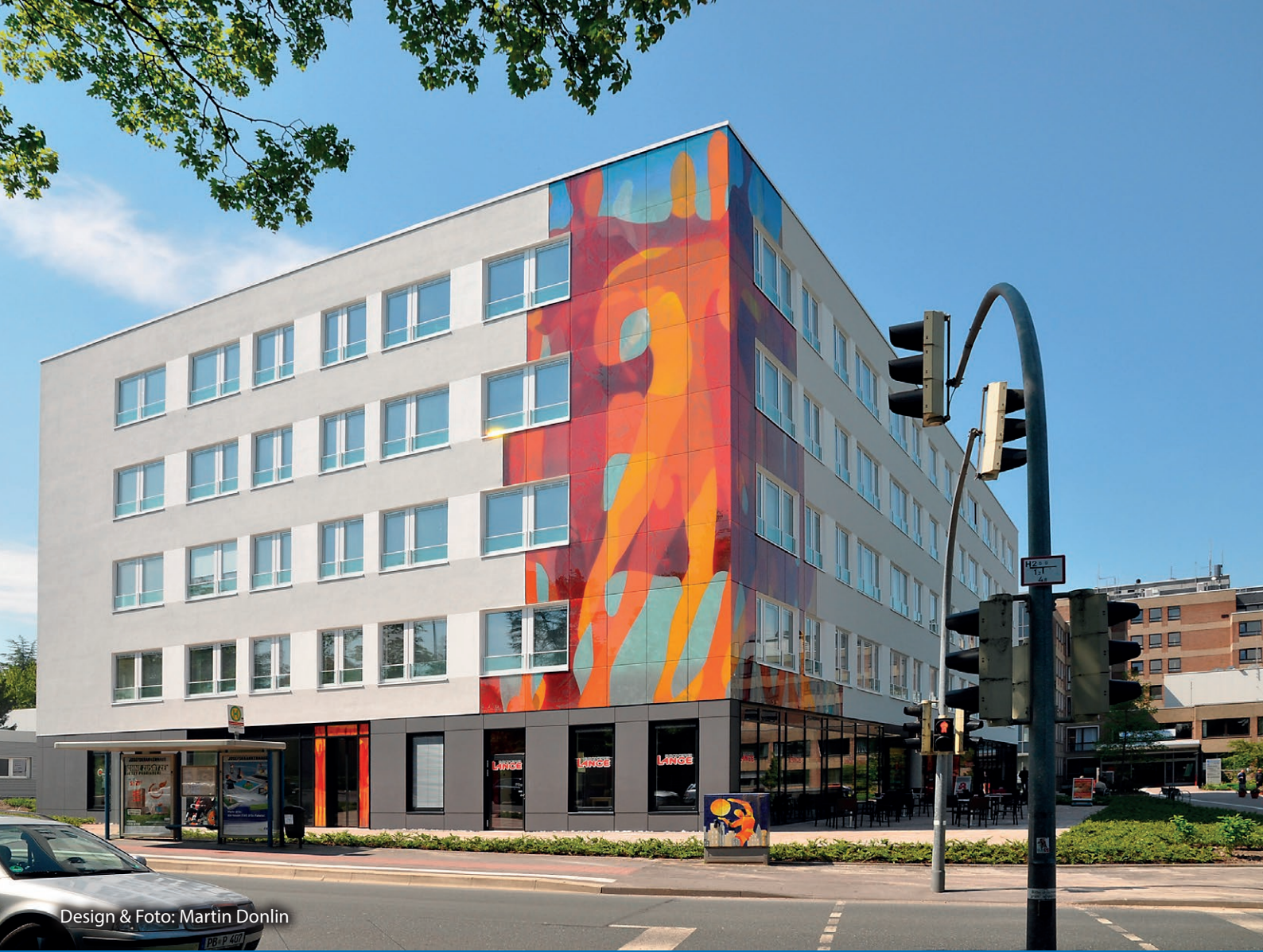
Design & Foto: Martin Donlin