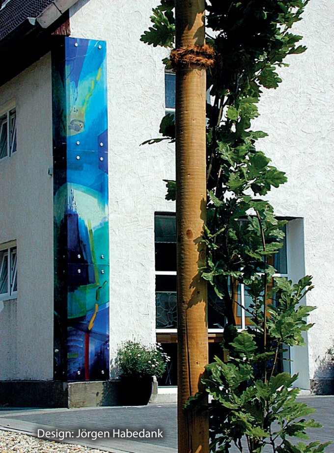
Design: Jörgen Habedank

Wir finden gemeinsam mit Ihnen den besten Ansatz für Ihr Projekt.