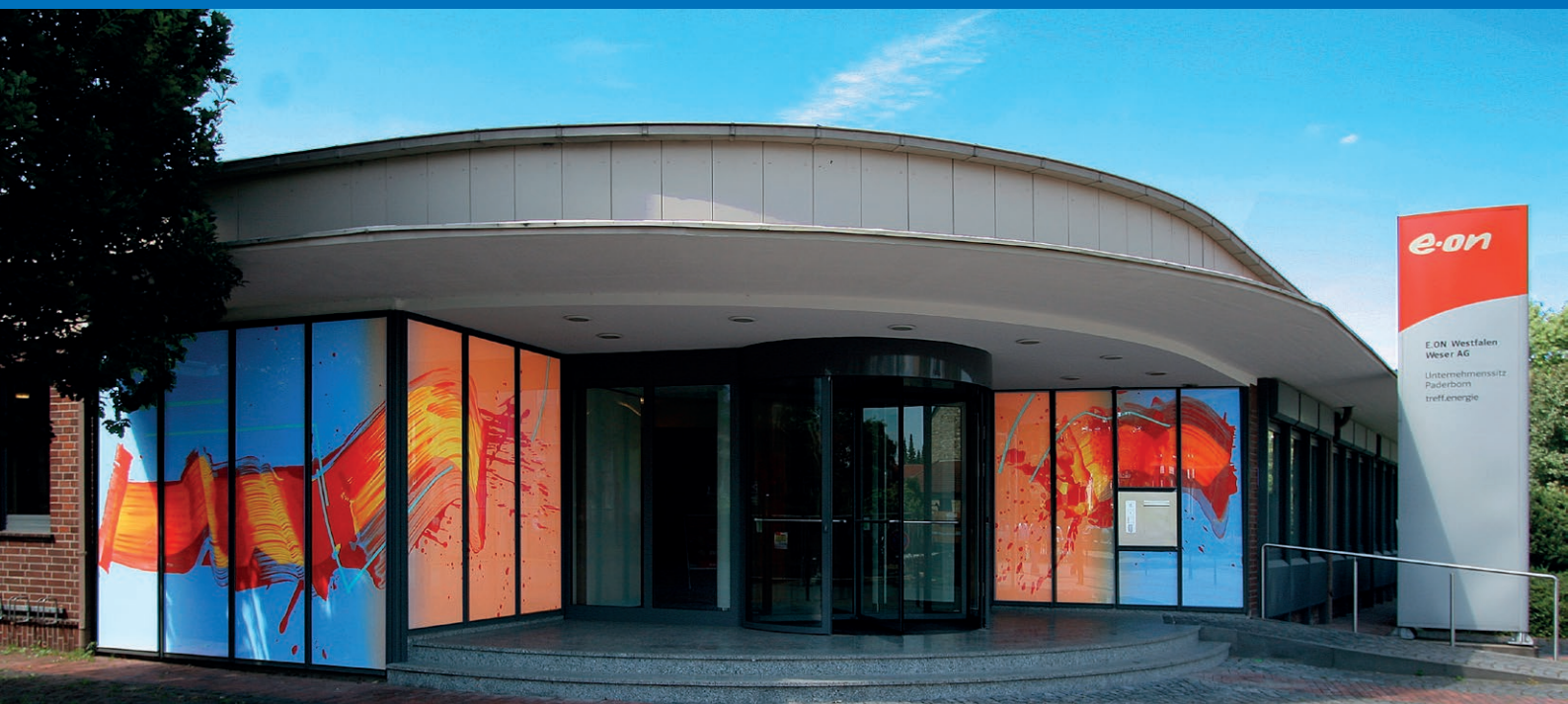
Design & Foto: Tobias Kammerer