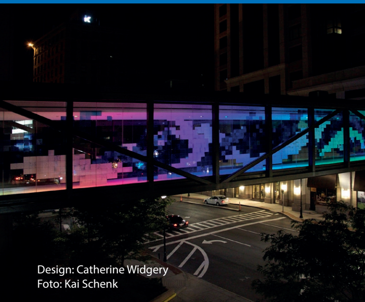
Design: Catherine Widgery