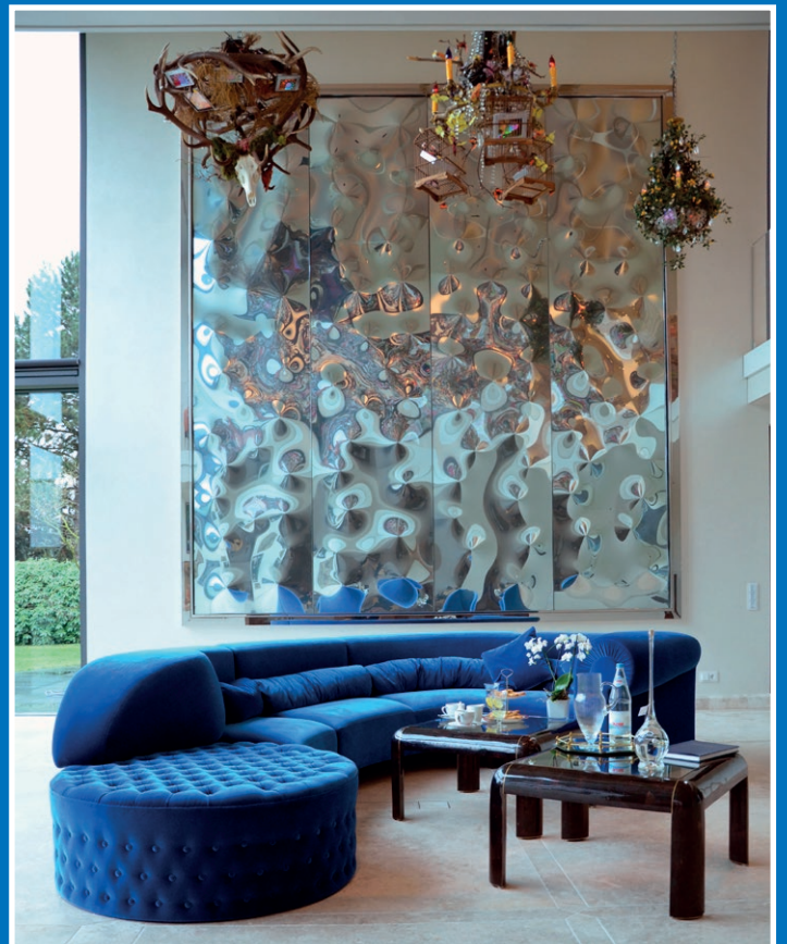
Mehrwert: KUNST generiert Aufmerksamkeit